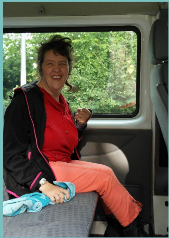
Elke dag hele goeie zin