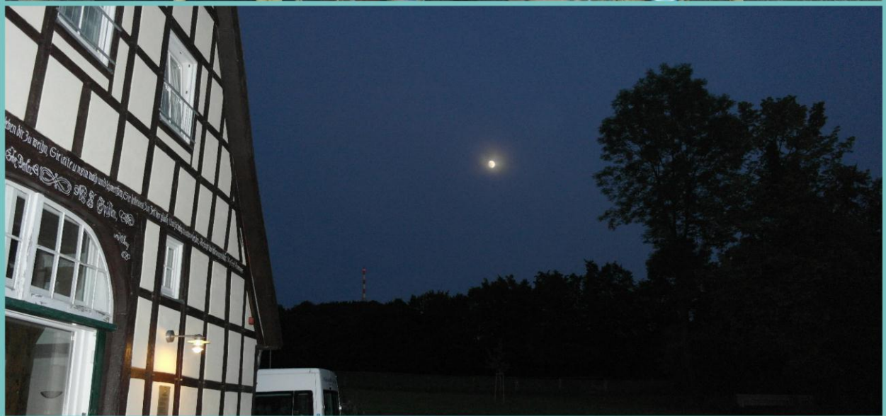
We doen nog een spelletje en gaan pas slapen als de maan al wakker is.