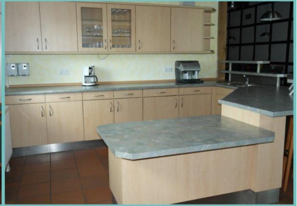
Hoeve Hoff Grothmann Tecklenburg.